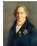
Liszt / Goethe - Bellagio