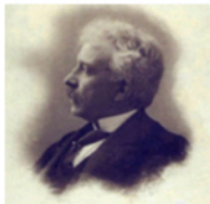
Stendhal - Griante