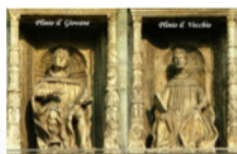
Como, i due Plinio