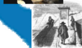
Manzoni / Leonardo - Lecco