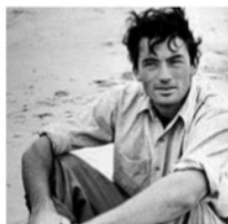
Hitchcock / Gregory Peck - Tyrone Power e Linda Christian Carla Fracci Isola Comacina