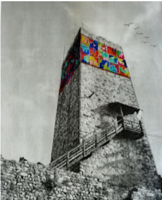
COMO CASTELLO BARADELLO SPINA VERDE

Questa opera collettiva sarà un richiamo per tutta la Rassegna di AQUAE DULCIS.